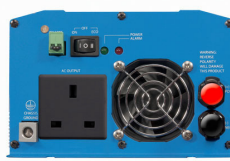
Phoenix Inverter 12/800 with BS 1363 socket