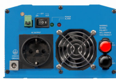
Phoenix Inverter 12/800 with Schuko socket