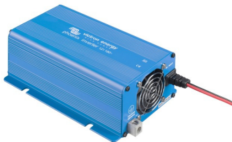
Phoenix Inverter 12/180