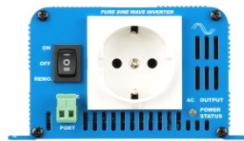
Phoenix Inverter 12/180 with Schuko socket