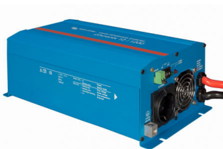
Phoenix Inverter 12/800 with Schuko socket