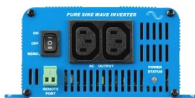
Phoenix Inverter 12/350 with IEC-320 sockets