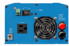
Phoenix Inverter 12/800 with Nema 5-15R socket