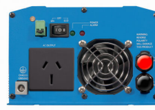
Phoenix Inverter 12/800 with AN/NZS 3112 socket