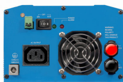
Phoenix Inverter 12/800 with IEC-320 socket